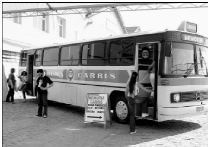
Bancos de bonde e painéis com fotos antigas estão no acervo

Diretores e professores de escolas da Capital que quiserem agendar uma visita do Museu Itinerante da Carris, que é sempre acompanhada por uma monitora de História, podem ligar para 3289-2143 ou enviar fax para a Assessoria de Comunicação e Marketing da empresa, no telefone 3289-2102, ou e-mail para asscom@carris.com.br .