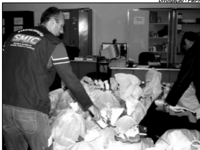
Ação surpresa encontrou mercadorias pirateadas e contrabandeadas

A operação surpresa foi realizada por 20 fiscais da Smic, dez PMs e foi acompanhada por dois representantes do Comitê Estadual de Combate à Pirataria e advogados representantes das marcas vítimas de pirataria.