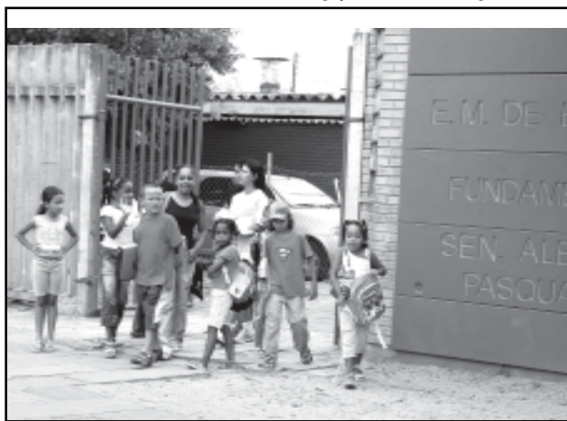
Rede municipal tem 92 escolas e atende cerca de 60 mil alunos