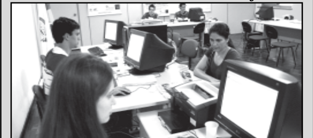
Os postos funcionam das 9h às 17h