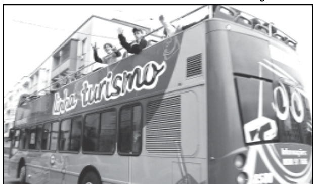
A doação de um caderno mais outro material de livre escolha dá direito a desconto de R$ 2