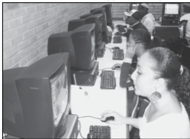
Escolas receberam novos laboratórios e equipamentos de informática