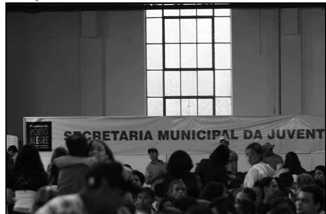
Ao todo, 1.668 jovens foram selecionados

oportunidade de inserção no mercado de trabalho ao final do curso. Informações podem ser obtidas no telefone (51) 3289-1732. A relação dos alunos está disponível no site www.portoalegre.rs.gov.br/smj .