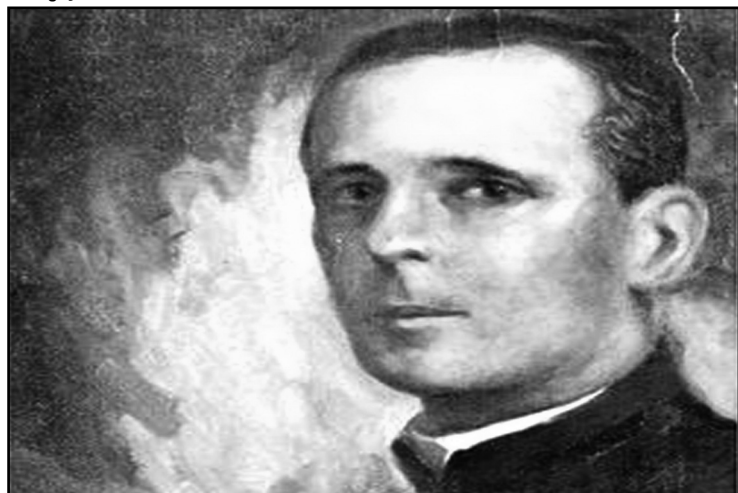
Landell de Moura é considerado o pai brasileiro do rádio

O Gabinete de Inovação e Tecnologia (Inovapoa) encaminhou à Câmara Municipal o Projeto de Lei nº 058/10, que institui o ano de 2011 como "Ano da Inovação Padre Landell de Moura". A proposta tem por objetivo eternizar o reconhecimento da obra do brilhante padre e cientista gaúcho, criador do rádio, precursor do aparelho de telefone sem fio e outras de fantásticas invenções. A iniciativa também homenageia os 150 anos do nascimento de Landell de Moura (21 de janeiro de 2011).