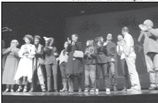
Medéia recebeu os prêmio Açorianos de melhor espetáculo de teatro adulto e Prêmio RBS - Júri Popular

No prêmio Tibicuera de Teatro Infantil o vencedor foi Píppi Meialonga , ficando a peça A Princesinha Fedorenta como melhor espetáculo eleito pelo júri no troféu RBS Cultura. As premiações foram entregues pelo prefeito municipal, secretário municipal da Cultura e a representante do grupo RBS. A platéia lotou o Teatro Renascença até o saguão do Centro Municipal de Cultura Lupicínio Rodrigues, onde telões mostravam as imagens