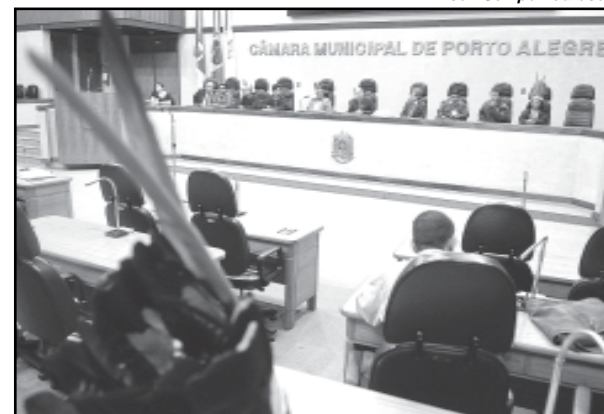
Indígenas reivindicam políticas públicas que garantam melhores condições

Textos elaborados e de responsabilidade da Assessoria de Comunicação da Câmara.