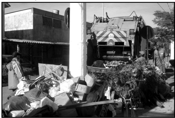
Ano passado foram atendidas 202 comunidades

O programa Bota-Fora teve origem em ações esporádicas similares que o DMLU fazia aleatoriamente na periferia da cidade. Em 2009, a partir de demandas do Orçamento Participativo, esse trabalho se transformou em um programa permanente: atendeu 199 vilas e deu destinação correta a 1.880 toneladas de entulhos. Em 2010 foram 202 comunidades atendidas. Em média, há atendimento a uma comunidade em cada dia (útil), do final de março ao início de dezembro. Esse programa não é apenas uma coleta de lixo que deixa as áreas públicas mais limpas nas comunidades por onde passa. Há a preocupação constante com a informação e a educação ambiental da população.