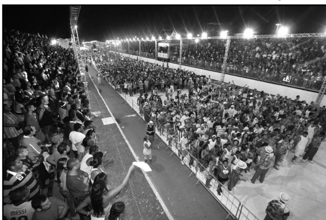
Desfiles terão entrada franca nos dois dias de evento

A rampa com iluminação especial que será instalada no recuo da bateria dará maior visibilidade ao local. Outra melhoria para os camarotes e arquibancadas é a ampliação do bar. Além de mudar de posição, os quatro guichês de pagamento ficarão do lado de fora, facilitando a circulação interna.