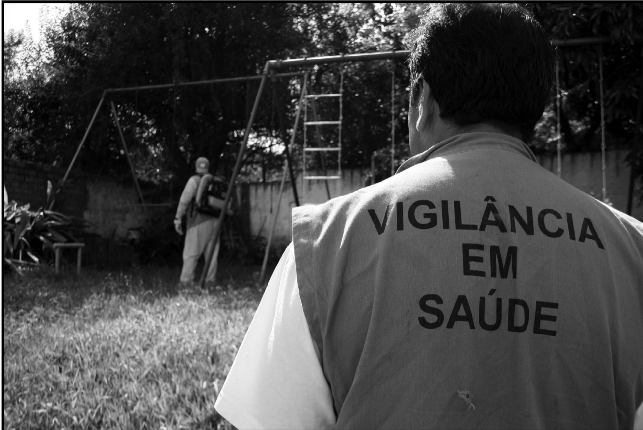
Denúncias e solicitação de inspeções devem ser feitas pelo telefone 156