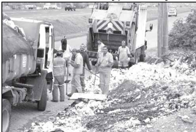
DMLU recolhe 300 toneladas/mês de lixo descartado irregularmente