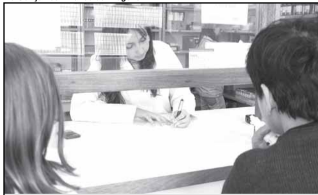
Unidade Básica de Saúde Sarandi iniciou reformas no prédio

A administração municipal dá continuidade ao cronograma de obras nas unidades de saúde do município. A Unidade Básica de Saúde Sarandi iniciou as reformas na última semana. Desde outubro de 2007, a Secretaria Municipal da Saúde (SMS) recuperou 51 unidades. Na UBS Sarandi estão sendo realizados serviços para a recuperação do telhado, grades,