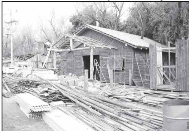
Montagem dos galpões começa em 23 de agosto

Farroupilha terá investimentos de cerca de R$ 90 mil reais entre recursos próprios, parcerias com a iniciativa privada, patrocínio, publicidade e serviços de infra-estrutura da prefeitura. A expectativa dos organizadores é receber mais de um milhão de visitantes, superando a visitação do ano passado, de 900 mil pessoas.