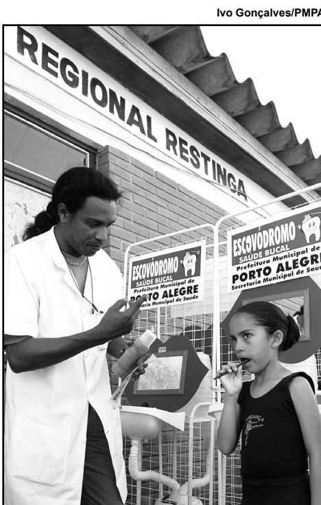
Centros Administrativos Regionais poderão ter suas atividades ampliadas

O prefeito destacou que programa precisava de ajustes, e que um grupo de trabalho já vinha atuando desde abril para avançar em relação ao tema. Pela proposta, o instituto terá natureza pública de direito privado, nos moldes do que já funciona no município de Canoas. Atualmente, estão em atividade 93 ESFs. Segundo Fortunati, até o final de 2011, esse número deve chegar a 140 unidades.