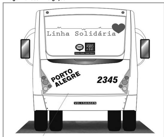
Ônibus personalizado fará o transporte até os locais de doação

A Carris lança nesta manhã, 25, o projeto Linha Solidária, em solenidade a partir das 10h30, no Paço Municipal (Praça Montevideu, 10). Com o objetivo de incentivar a cidadania em Porto Alegre, a empresa irá destinar um ônibus personalizado ao transporte de grupos de pessoas para doação de sangue nos postos de coleta da Capital. O projeto conta com apoio do Hemocentro do Estado do Rio Grande do Sul (Hemorgs) e dos hemocentros da Santa Casa de Porto Alegre, Hospital de Clínicas e Hospital de Pronto Socorro.