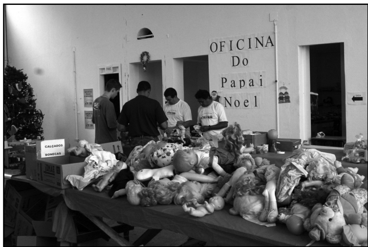
Na oficina do Papai Noel, servidores da prefeitura e voluntários trabalham na reforma dos brinquedos

A expectativa para 2010 é de que 80 mil brinquedos sejam entregues em kits para mais de 18 mil crianças em Porto Alegre. Nas lojas do grupo Zaffari, há caixas de coleta até 23 de dezembro. O ponto alto da campanha será domingo, 5 de dezembro, no Parcão (acesso pela avenida Mostardeiro), das 9h, às 13h, quando acontece o Pedágio do Brinquedo. No local, várias atividades gratuitas estão programadas para as crianças, como pinturas no rosto, desenhos para colorir, brinquedos de balões, recreacionistas, brinquedos infláveis e fotos com o Papai Noel.