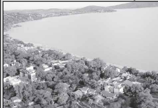
Acervo do projeto está sendo montado com apoio da comunidade