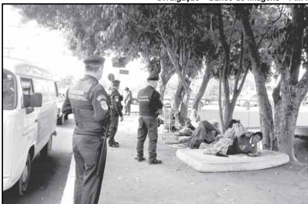
Guarda Municipal apoiou a abordagem de mais de 80 moradores de rua