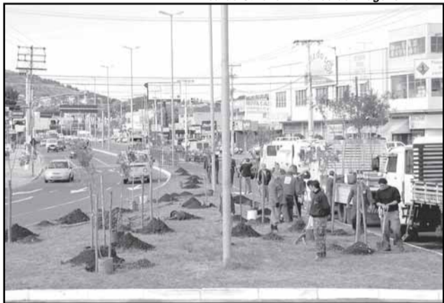
A pesquisa vai auxiliar os projetos de arborização para logradouros públicos