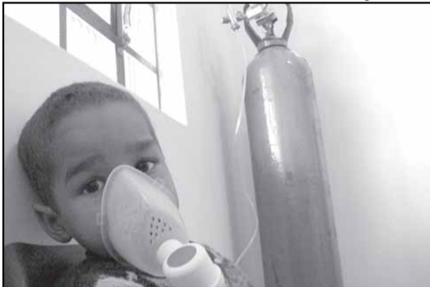
O PSF Cruzeiro do Sul está realizando cerca de 50 nebulizações por dia