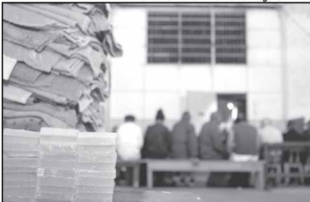
A Fasc dispõe de cerca 600 vagas, entre a rede própria e conveniada, para o atendimento da população adulta de rua