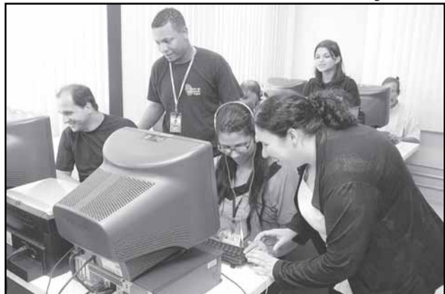
Nas salas online da Usina do Gasômetro e Terceira Idade, houve 5187 acessos à Internet de janeiro a maio

De janeiro a maio de 2009, o Centro de Capacitação Digital (CCD) da Procempa formou 1.108 pessoas, sendo 436 idosos. O CCD mantém cursos gratuitos de informática nas unidades Usina do Gasômetro, Restinga, Terceira Idade -