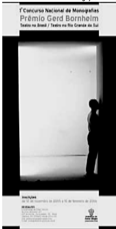
Concurso teve 73 concorrentes de vários estados

A Prefeitura, através da Secretaria Municipal da Cultura (SMC), divulgou o resultado do 1º Concurso Nacional de Monografias – Prêmio Gerd Bornheim. O objetivo é incentivar a produção de estudos críticos sobre teatro. O concurso vai conceder prêmios em dinheiro e publicar um livro com os três melhores ensaios em cada uma das categorias: Teatro no Brasil e Teatro no Rio Grande do Sul.