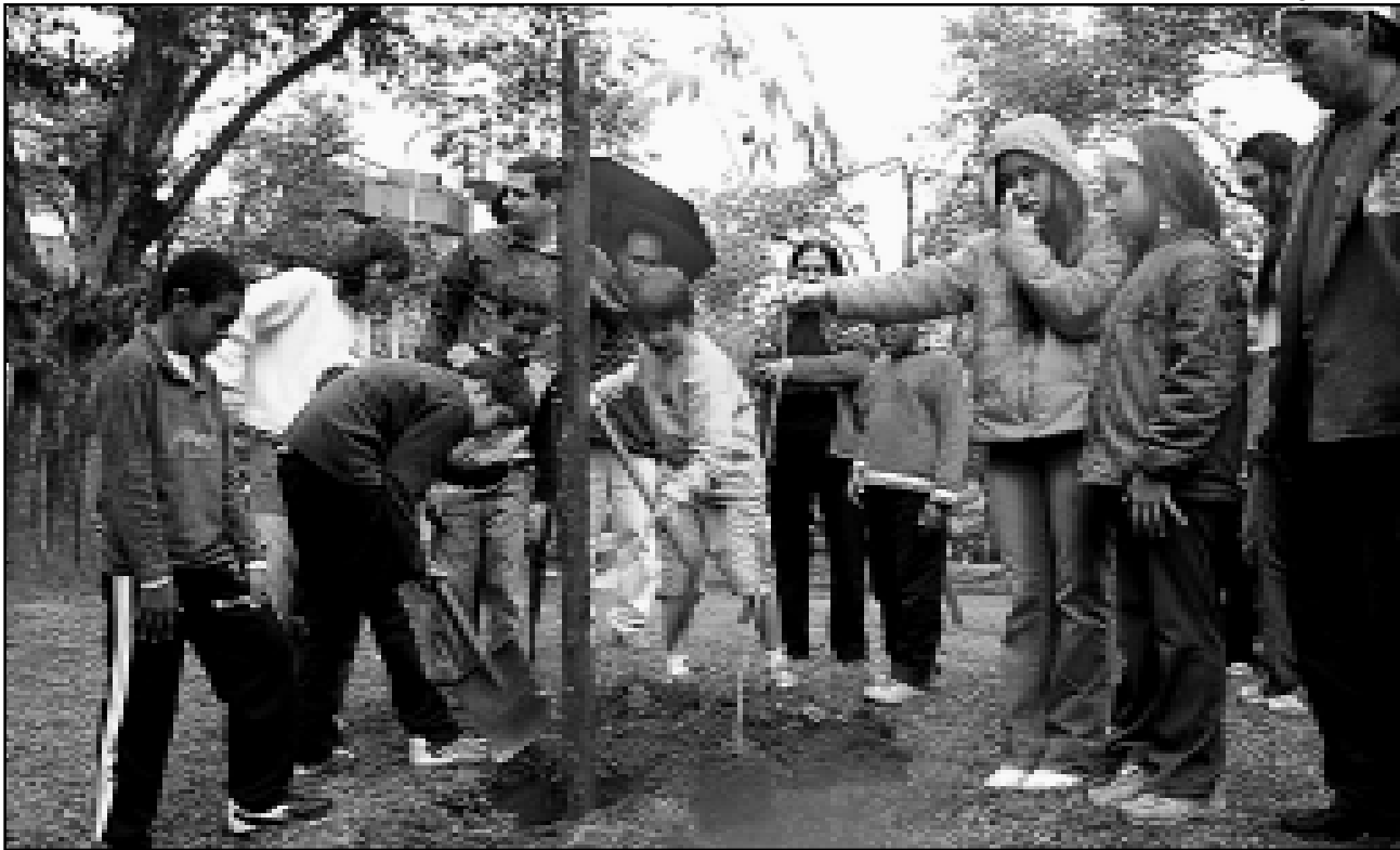
Meta é ultrapassar as 9050 mudas plantadas ano passado