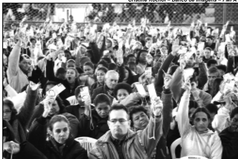
Foram apreciadas 347 propostas encaminhadas pela sociedade à prefeitura