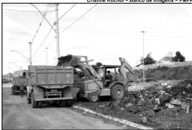
Caminhões realizaram 35 viagens para remover 175 metros cúbicos de resíduos

Nesta semana, a calça que sobrou será utilizada para movimentar a terra e construir barreiras naturais, em desnível, que impossibilitem o acesso de pessoas, caminhões e carretas costumam descartar o lixo naquela área.