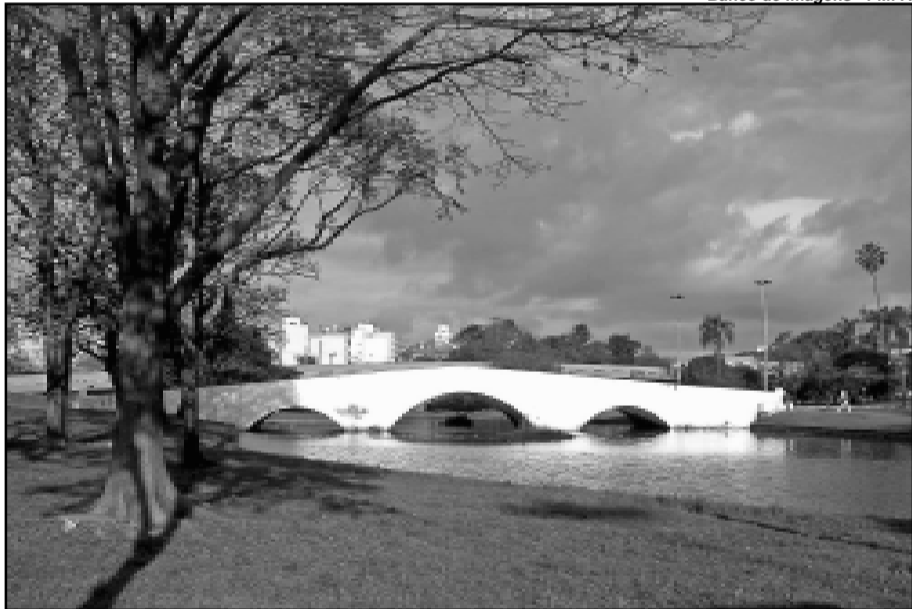
Grupo estava no Largo dos Açorianos