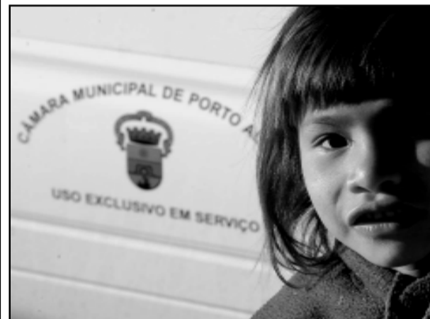
Índios serão tema de audiência pública