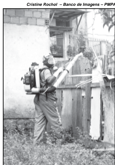
O bloqueio do mosquito adulto prioriza as áreas onde há casos suspeitos

Os bloqueios do mosquito adulto, realizado pela Coordenadoria de Vigilância em Saúde em todas as áreas onde há casos suspeitos, prioriza, no momento, os bairros Floresta, onde há dois casos confirmados; Petrópolis, também com dois casos, e Jardim Carvalho, onde há um morador com dengue. Nos três bairros, a Pesquisa Vetorial Especial (PVE) confirmou a presença do mos-