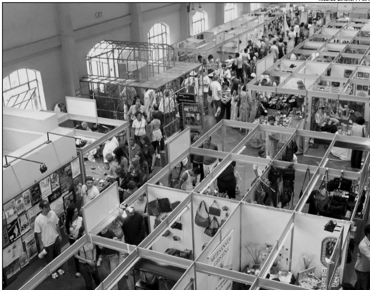
Ano passado, 156 expositores participaram da Feira Latino-Americana