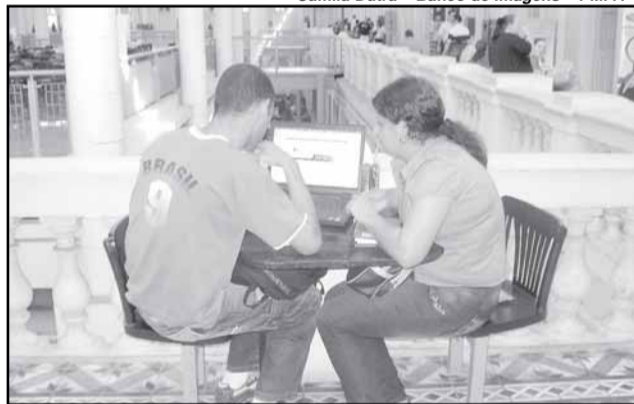
A rede sem fio atrai visitantes para o Mercado Público, aumentando a circulação e vendas no local

pleta 140 anos em 3 de outubro, é uma opção para acesso livre à Internet no Centro Histórico. Desde 2007, a Procempa, em parceria com a Smic, instalou no local a rede wireless pública, que permite a conexão de notebooks à Internet gratuitamente. A rede sem fio atrai e beneficia os visitantes do Mercado Público, aumentando a circulação e vendas no local.