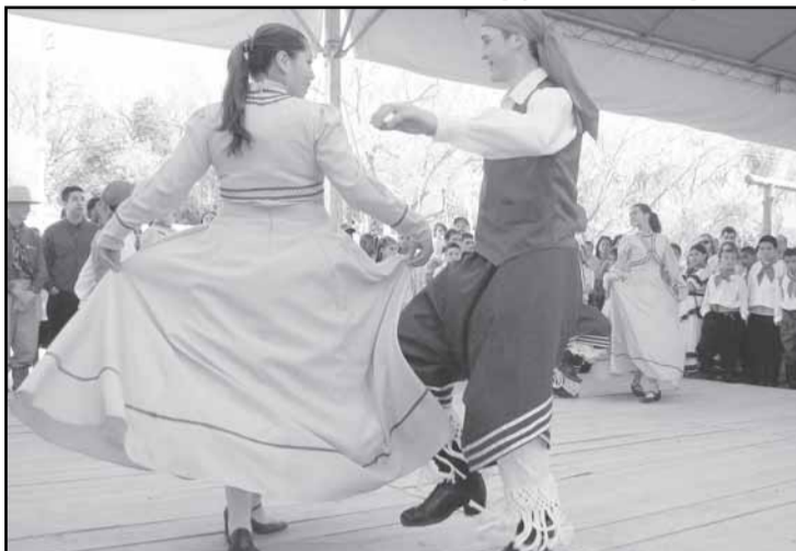
Performances traz coreografias projetadas em temas regionalistas

Serviços de saúde — Faltando poucos dias para a abertura do evento, o Acampamento Farroupilha já conta com serviço de saúde no Parque Maurício Sirotsky Sobrinho para atender tradicionalistas, trabalhadores e frequentadores. Uma ambulância