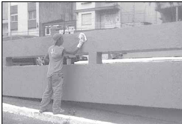
Desde 2007, equipe do DMLU protegeu oito viadutos com tinta especial