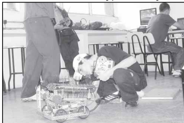
Trabalho nas escolas municipais motivou empresa expandir ação social

Para o presidente da Fasc, um dos grandes desafios da socieda-