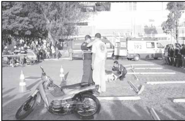
Socorro a vítimas de acidentes de moto é o mais comum