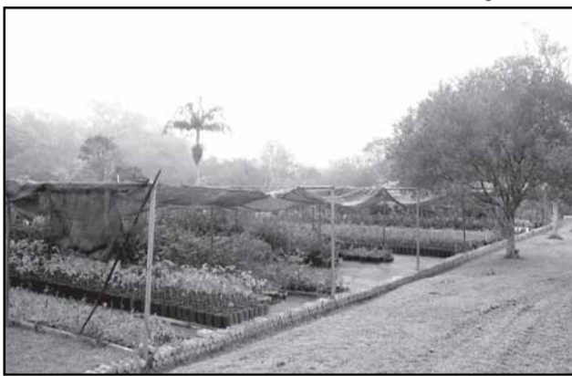
Banco de Sementes será instalado no viveiro municipal, com investimento total de 700 mil reais