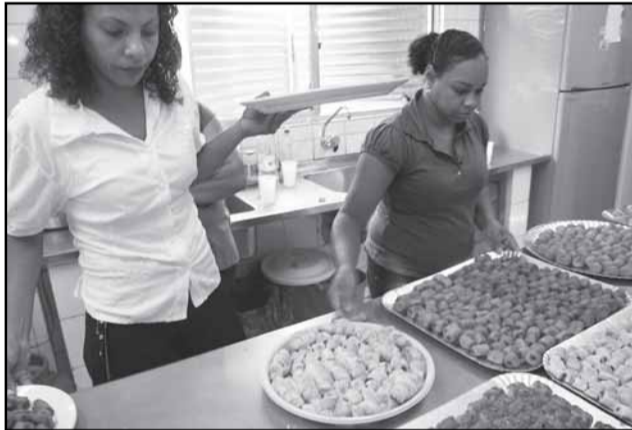
Qualificação tem ajudado o índice de desemprego em Porto Alegre ser o menor das capitais brasileiras desde 1992

Os cursos de qualificação profissional executados pela Secretaria Municipal da Produção, Indústria e Comércio (Smic), sob a supervisão da Comissão Municipal do Emprego (CME), seguem gerando oportunidades de capacitação para pessoas de baixa renda. Ações como essas têm ajudado o índice de desemprego em Porto Alegre ser o menor das capitais brasileiras desde 1992. De acordo com o titular da secretaria, o objetivo é mostrar para a população a importância do em-