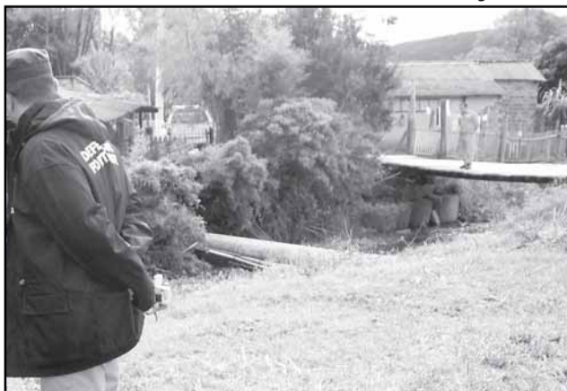
Defesa Civil, CAR Lomba do Pinheiro e representação do Orçamento Participativo realizam vistoria