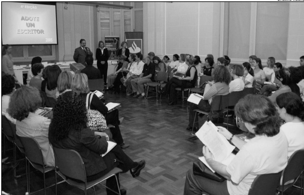
Parceria para aproximar autores e leitores

A Secretaria Municipal de Educação de Porto Alegre e a Câmara Rio-grandense do Livro lançaram a quarta edição do Programa de Leitura Adote um Escritor . O protocolo do convênio foi assinado pela secretária-adjunta da Smed e pelo presidente da Câmara do Livro.