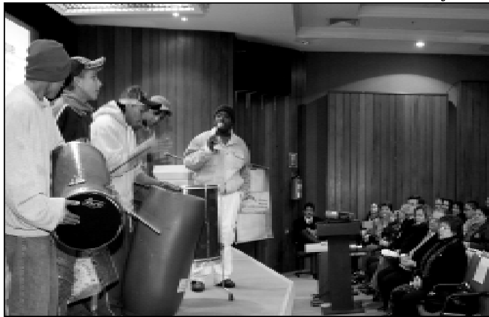
Abertura teve show do grupo Pagode Moleque