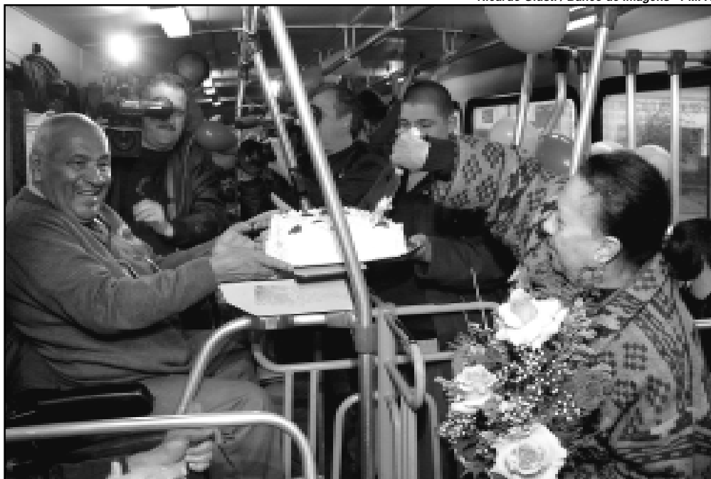
Desde 1994, Melancia (E) organiza festas de aniversário para os passageiros