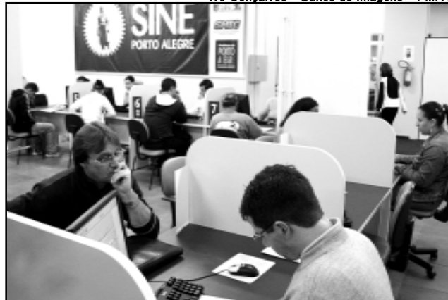
Os atendentes receberam treinamento de técnicos do Ministério do Trabalho e Emprego