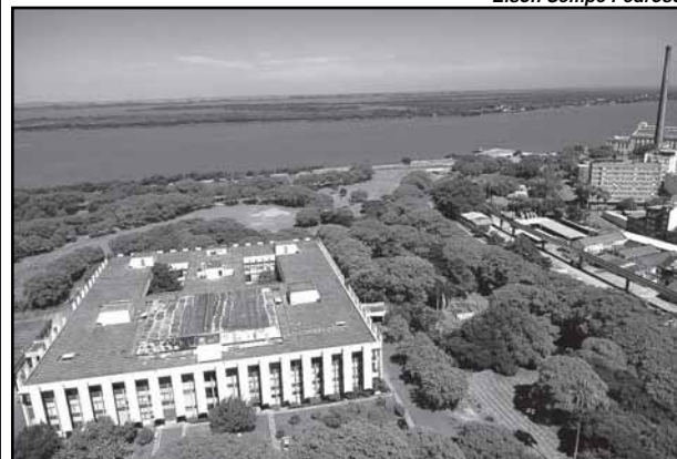
CMPA com o Lago Guaíba e Gasômetro ao fundo

Textos elaborados e de responsabilidade da Assessoria de Comunicação da Câmara