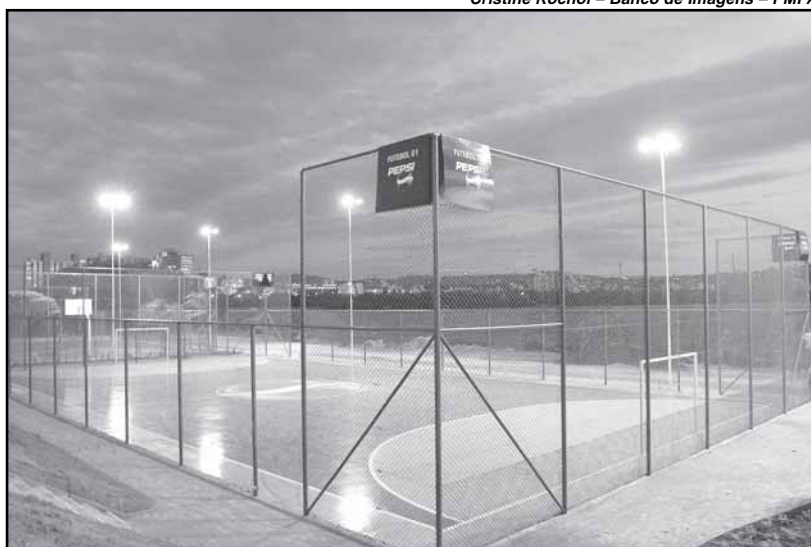
Novas quadras poliesportivas da orla do Guaíba estão prontas

espaço pelas empresas Pepsi e Sinergy Novas Mídias, por meio de acordo firmado com a Secretaria Municipal do Meio Ambiente.