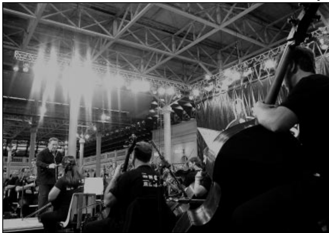
Orquestra mantém projeto de educação musical para aproximá-la da comunidade