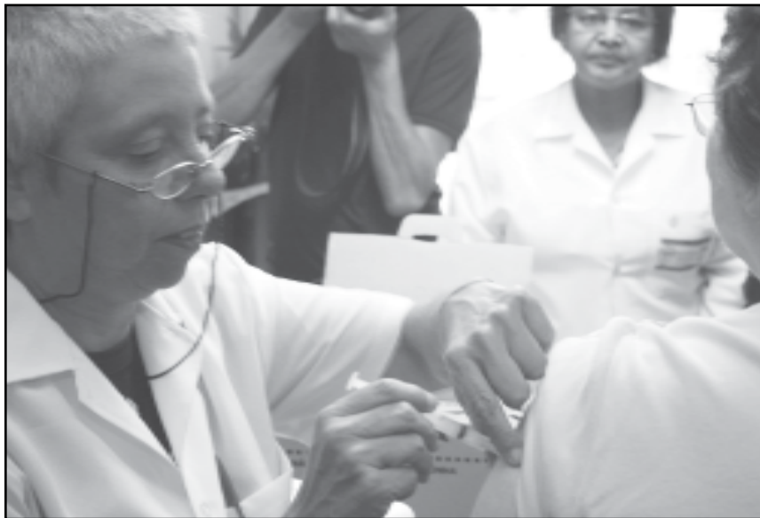
Os postos também mantêm a vacinação contra tétano e difteria para idosos que ainda não completaram o esquema de três doses

Proteção — Estudos demonstram que a vacina é eficaz em reduzir as complicações da gripe, principalmente as internações hospitalares por pneumonia, além de diminuir complicações que podem levar à morte. A vacina protege de