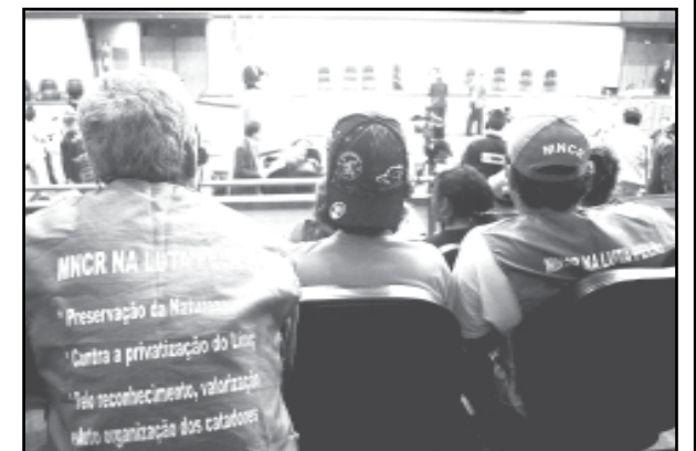
Catadores e carroceiros têm acompanhado discussões na Câmara

Textos elaborados e de responsabilidade da Assessoria de Comunicação da Câmara