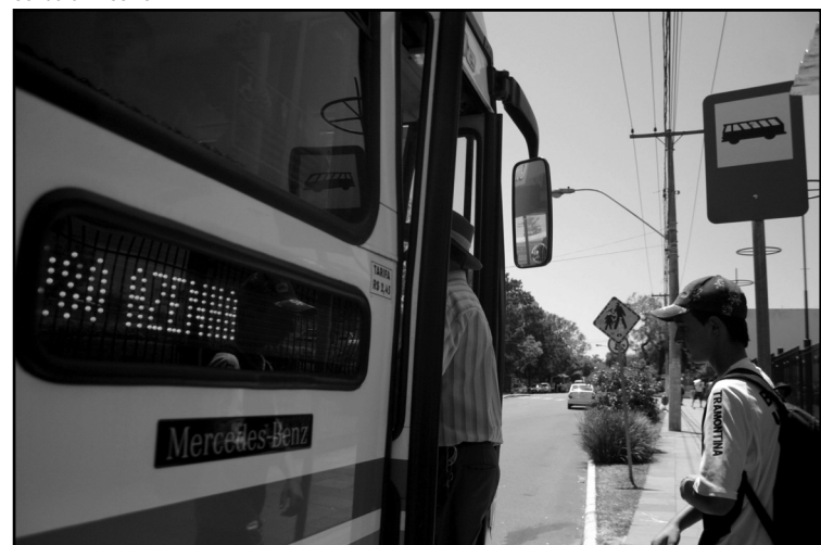
Prefeito destacou o transporte coletivo como fator de inclusão

que serão enfrentados e buscamos soluções mais adequadas para qualificar áreas tão importantes quanto a mobilidade urbana com inclusão social. Não tenho dúvida de que a inclusão social significa investir cada vez mais em transporte coletivo”, reforçou.