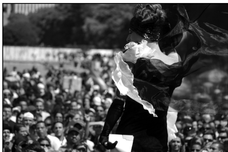
Programação prevê Parada Livre

de Porto Alegre pretende discutir, por meio de uma programação simbólica, plural e diversificada, políticas públicas de direitos humanos, que possibilitem a equidade de direitos, o fortalecimento dos avanços alcançados e a justiça social.