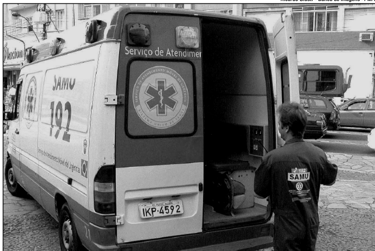
De abril a junho deste ano, foram recebidos mais de 68 mil chamados e realizadas mais de 14 mil regulações médicas