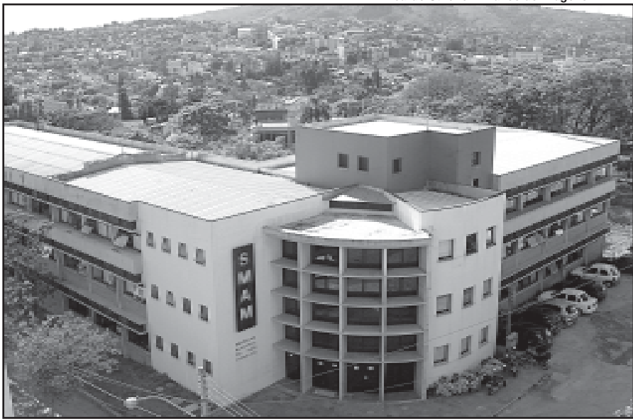
A Smam foi a primeira Secretaria Municipal do Meio Ambiente criada no País