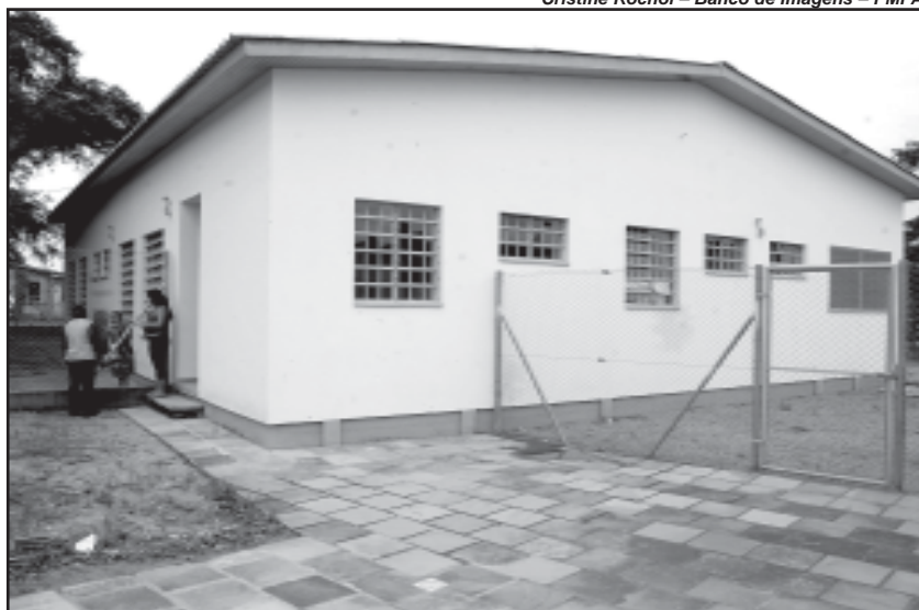
A Creche Palhaço Feliz vai atender 60 crianças de 0 a 6 anos