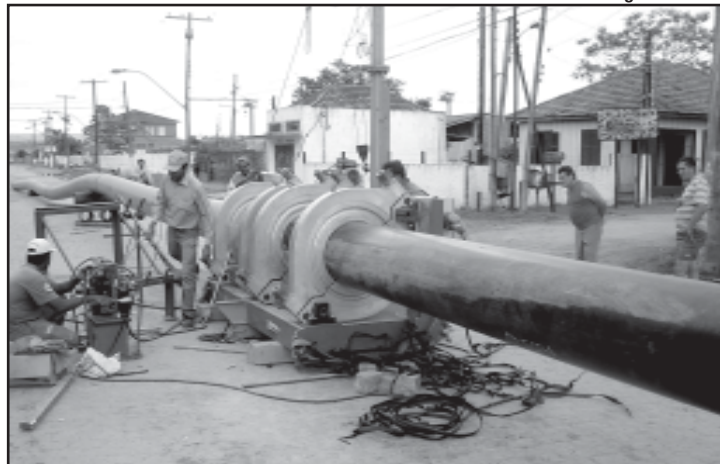
Foi utilizado um processo não-destrutivo na execução da obra