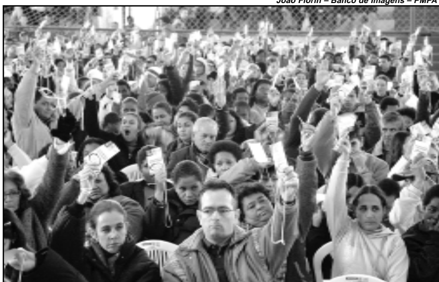
As propostas foram aprovadas em audiência pública

A Comissão responsável pelo estudo, formada por oito Conselheiros do CMDUA, trabalhou para ajustar as novas sugestões à atual Legislação, contando com o apoio de técnicos da SPM. “Este trabalho foi vital para agilizar as deliberações do Conselho e respaldar seu parecer”, garante o titular do Planejamento de Porto Alegre. A partir desta quinta-feira, até o final do mês de julho, os conselheiros irão debater o tema e elaborar relatório final, que será remetido ao prefeito municipal. De posse desse documento, o chefe do executivo formatará o projeto de lei a ser enviado à Câmara Municipal, provavelmente, na primeira quinzena de agosto.