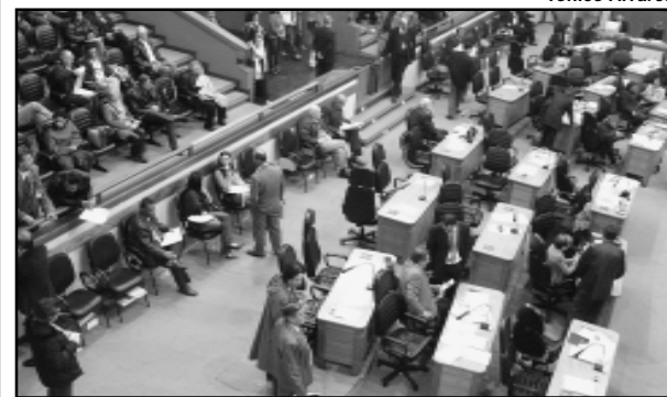
Plenário da CMPA