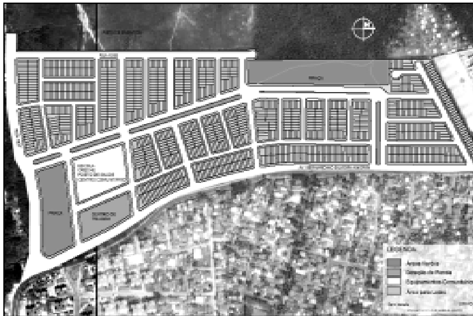
Reunião tratou de projetos como o do Demhab, para a Vila Dique

A reunião na Casa Civil contou com a participação da governadora Yeda Crusius e outros prefeitos gaúchos. Acompanharam o prefeito os diretores dos departamentos municipais de Água e Esgotos (Dmae), Esgotos Pluviais (DEP), e Habitação (Demhab) e o secretário-adjunto da Fazenda. Em Brasília, o prefeito reuniu-se ainda no Ministério da Saúde com o secretário substituto de Atenção à Saúde, João Gabbardo dos Reis, para tratar sobre os recursos do QualiSUS.