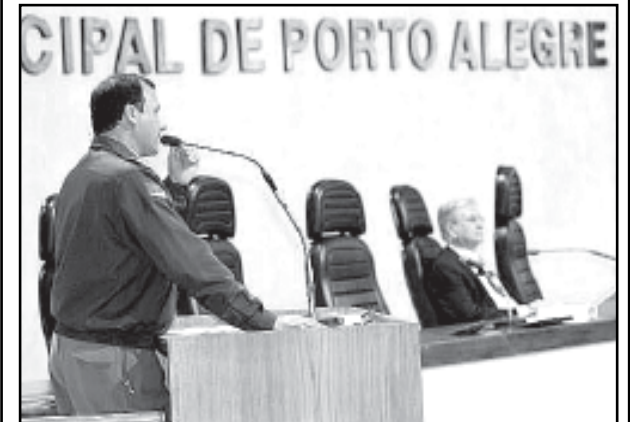
Textos elaborados e de responsabilidade da Assessoria de Comunicação da Câmara.

Ao final o major Minuzzi solicitou colaboração dos vereadores na divulgação das informações e a convocação de empresas que ajudem a amenizar os problemas que ocorrem principalmente nas famílias carentes. “O incêndio ocorre onde a prevenção falha”, afirmou.