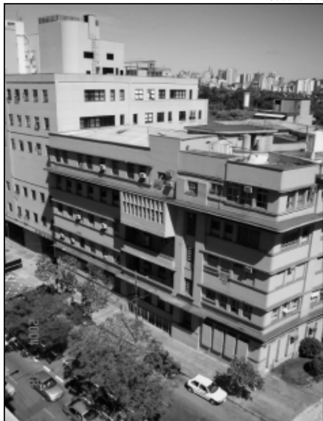
HPS – 61 anos de respeito pela vida