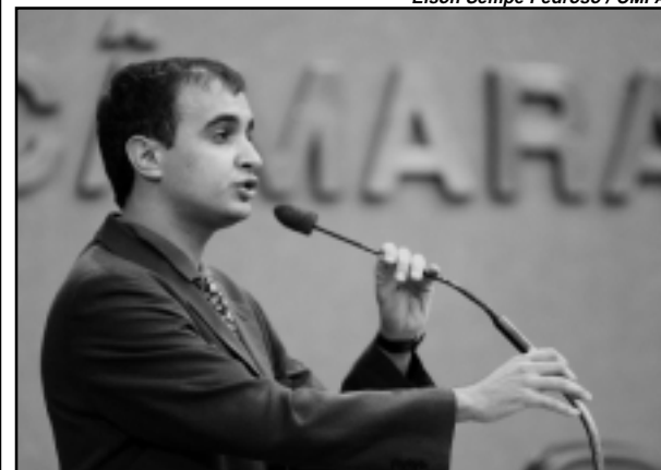
Petta, da UNE, compareceu à Câmara