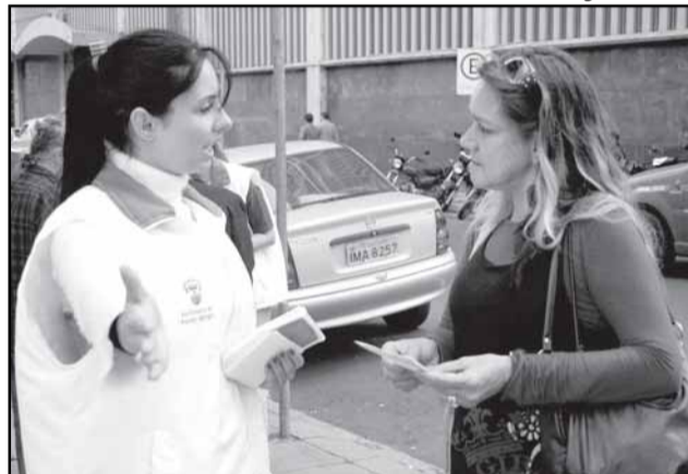
Monitores atuam em cruzamentos com intenso fluxo de pedestres e carros