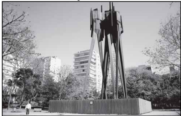
A reforma, com custo de R$ 88 mil, é resultado do acordo firmado entre a prefeitura e os adotantes do Parque