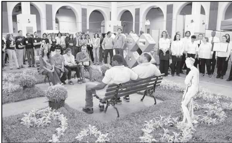
Abertura é realizada tradicionalmente no Quarto Quadrante do Mercado