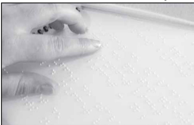
Ferramenta adapta técnica de transcrição de texto para a musical