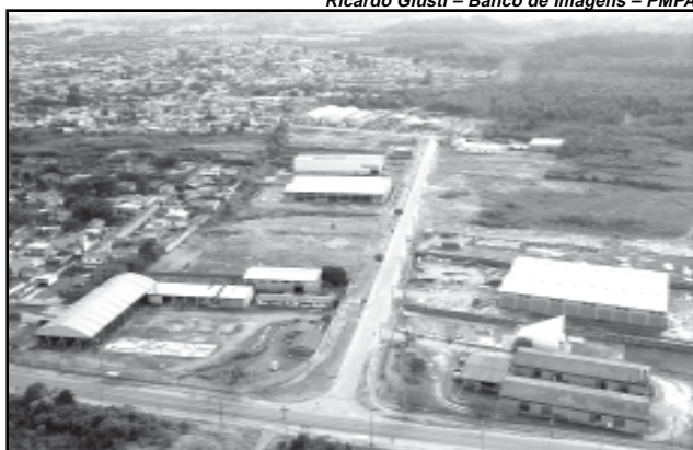
Parque Industrial da Restinga já tem 13 empresas