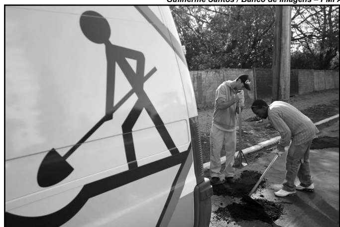
Cento e quarenta e oito trechos de ruas e avenidas foram revitalizados

Após longo período sem investimentos de grande dimensão na malha viária de Porto Alegre, o programa de Revitalização Asfáltica já restabeleceu mais de 64 quilômetros de vias. “Este é um dos serviços prioritários que a prefeitura executa com vistas à mobilidade e qualidade de vida das pessoas”, ponderou o titular da Smov. A previsão para conclusão das obras na Cabral e Rodolfo Simch é de 15 dias.