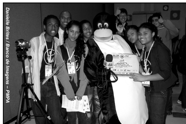
Integrantes do Alunos em Rede acompanham atividades até sábado

Projeto Alunos em Rede – Mídias Escolares – Existente desde 2006, a ação do setor de Inclusão Digital da Smed é voltada para jovens de 8 a 15 anos. O trabalho é direcionado a diversas mídias (blog, rádio, vídeo). Os estudantes aprendem a utilizar as ferramentas necessárias à construção de conteúdo, fazem cobertura e veiculam informações sobre eventos gerais e da prefeitura. Atualmente, participam 14 escolas de ensino fundamental. Mais informações em http://www.alemrede.blogspot.com .