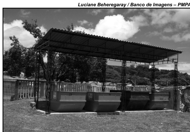
Ecoponto (Destino Certo) na rua Cruzeiro do Sul

A primeira unidade de Destino Certo foi inaugurada no dia 24 de fevereiro passado e está localizada à rua Cruzeiro do Sul, 1.445. Essas unidades visam atender pequenos geradores,