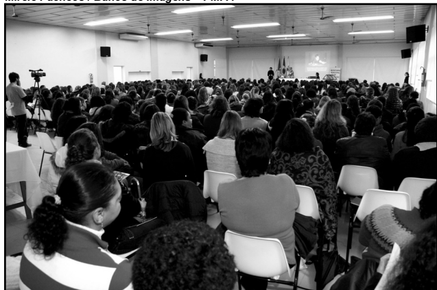
Evento acontece na Igreja Pompeia