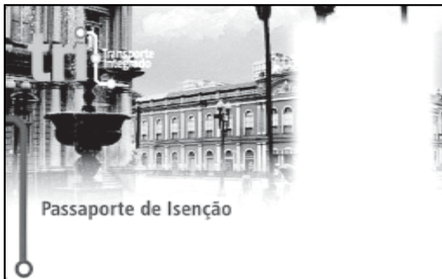
Serão apresentados os modelos de cartões que serão utilizados no novo sistema

O TRI possibilita a formação de uma rede de transporte com itinerários integrados, que beneficia usuários com descontos na passagem integrada. Quando o sistema estiver plenamente implantado, o passageiro que hoje necessita utilizar dois ônibus para seu deslocamento, pagará a primeira passagem inteira e a segunda com 50% de desconto. No futuro, o