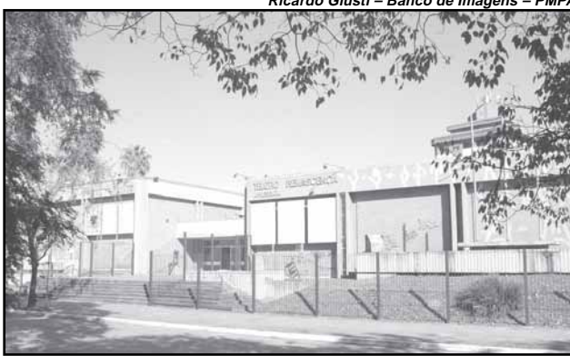
Centro Municipal de Cultura passou a chamar-se Lupicínio Rodrigues em 1986

Reconhecimento — Atualmente, as verbas do projeto vêm de repas-