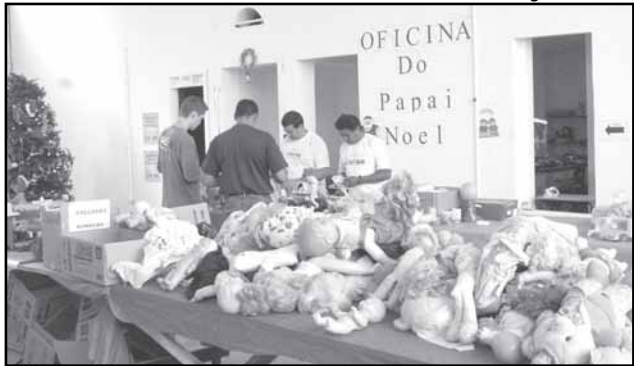
Até o natal, a oficina deverá atender mais de 15 mil crianças e beneficiar cerca de 60 instituições