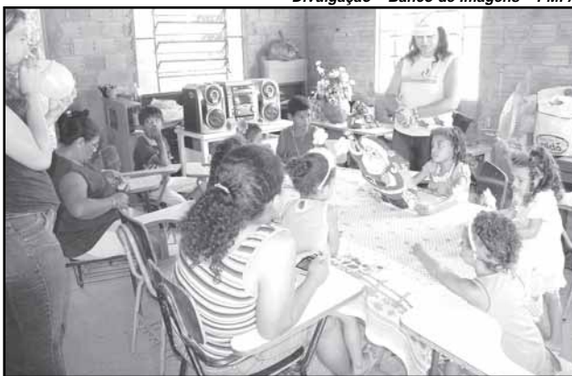
Primeira festa foi na Ilha das Flores

Como doar — Até 22 de dezembro, brinquedos, novos ou usados podem ser doados em qualquer loja da rede Zaffari/Bourbon ou diretamente no Cais do Porto. A prefeitura também colabora com a iniciativa solicitando doações junto a empresas privadas e órgãos do município. A expectativa para esse ano é superar o número de doações recebidas na última edição da campanha, em 2007, quando mais de 12 mil crianças assistidas por associações, entidades, abrigos e creches mantidas pela prefeitura foram beneficiadas. Informações pelo telefone 3289 8491 ou 3289 8490.