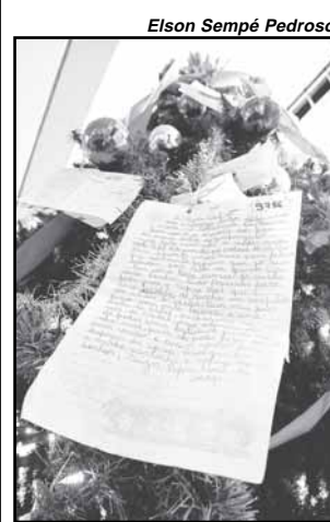
Cartas de crianças carentes enfeitam a árvore

Os próprios Correios reconhecem que alguns pedidos expressos nessas cartinhas são difíceis de serem atendidos. Contudo, a empresa sugere que mesmo assim as cartas sejam adotadas sendo encaminhados como resposta brinquedos, material escolar, roupas ou cestas básicas. Na Câmara, as cartas de pedidos para Papai Noel estão enfeitando a árvore de Natal localizada na porta da rampa de