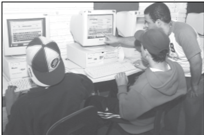
Curso tem duração de dois meses e é reconhecido pelo Serpro