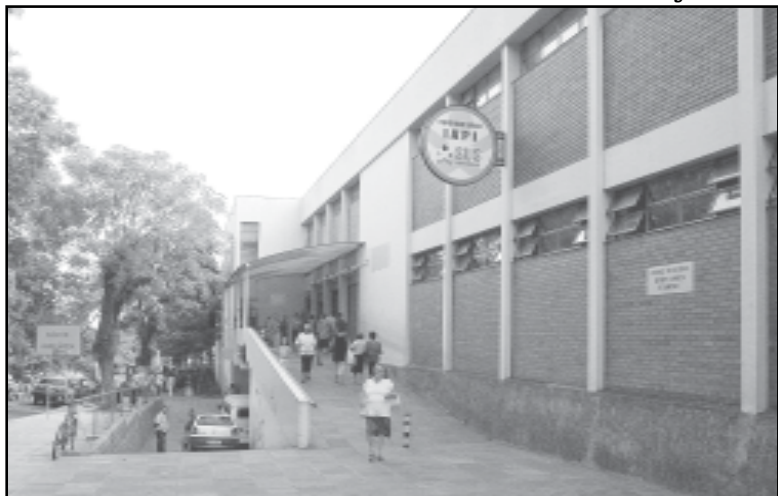
O atendimento será de segunda a sexta-feira, das 8h às 18h