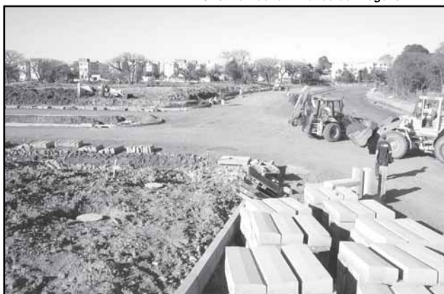
As obras de infra-estrutura estão 70% concluídas