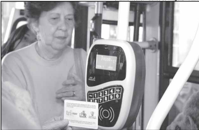
Usuários de vale-transporte já podem utilizar o desconto de 50% na segunda viagem