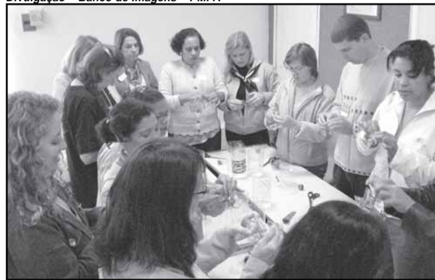
Curso reúne professores municipais, estaduais e particulares

O Departamento Municipal de Limpeza Urbana (DMLU) promove, nesta semana, mais uma edição do curso Chega de Lixo, desta vez dirigido exclusivamente a professores. Desde terça-feira, 35 representantes de escolas municipais, estaduais e particulares participam das atividades, que incluem oficinas, exposição teórica, apresentação teatral e visita a uma unidade de triagem.