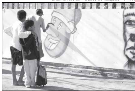
Graffiti vai representar as artes plásticas

As oficinas atenderão a cerca de 30 alunos entre 12 e 14