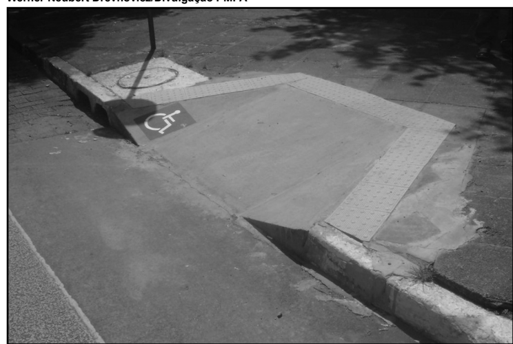
Unidades pré-moldadas obedecem à norma da ABNT