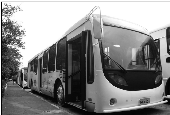
Ônibus personalizado da Carris faz o transporte até os locais de doação

A Companhia Carris ampliou o Projeto Linha Solidária, cujo objetivo é proporcionar o transporte gratuito de moradores de comunidades até os principais hospitais de Porto Alegre para realizar a doação de sangue. A partir de seu lançamento, no começo de dezembro, o serviço funcionava com agendamento prévia uma vez por semana. Agora, devido à grande procura, passa a ser disponibilizado duas vezes semanais e excepcionalmente aos sábados. Os horários do transporte podem ser confirmados pelos interessados via telefone, através do número 3289-2122, ou via internet, pelo e-mail linhasolidaria@carris.com.br .