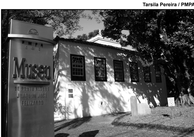
Roteiro programado para 19 de fevereiro inclui o Museu Joaquim José Felizardo

Leia mais no http://www.portoalegre.rs.gov.br/portal_pmpa_novo/