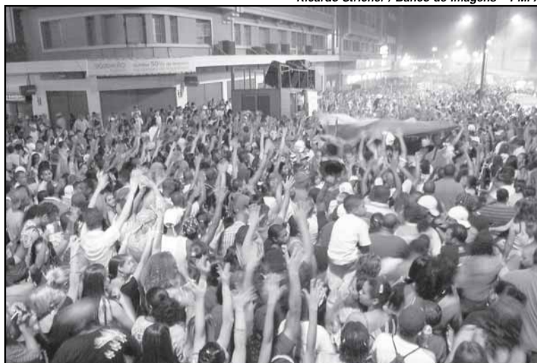
Evento reúne milhares de pessoas no Centro Histórico

Organizada pela Irmandade de Nossa Senhora dos Navegantes, a 135ª edição da procissão ocorrerá terça-feira, 2, feriado na Capital. A ima-