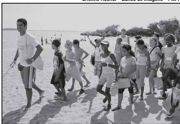
Alunos são atendidos por professores, estagiários de Educação Física e voluntários