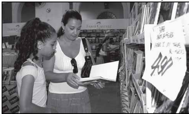
Pesquisas semanais mantêm os preços abaixo do mercado