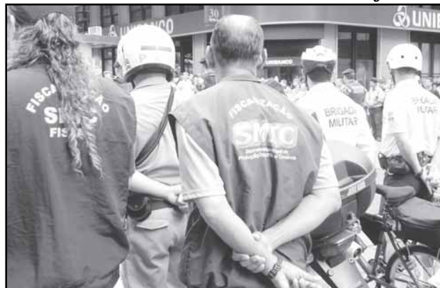
Convênio vai combater comércio de produtos piratas, contrabandeados ou de origem desconhecida