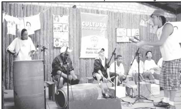
Mostra reúne trabalhos de oficinas desenvolvidas desde abril, em todas as regiões da cidade