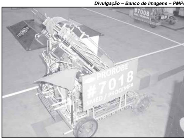
A competição classificou a equipe Prorobe em primeiro lugar, ao lado da Eniac, de São Paulo

Prova — No dia 28, as equipes conheceram o local da disputa e