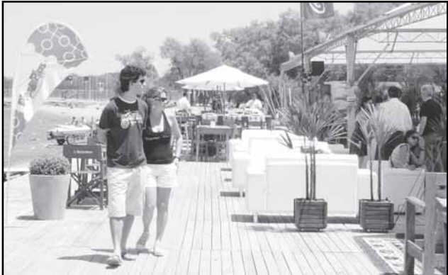
Evento reúne mais de 150 expositores de vários países