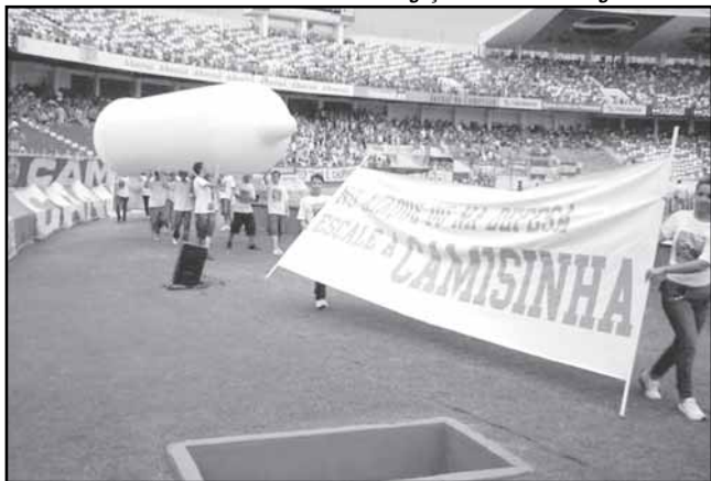
No Beira-Rio, promoção alusiva ao Dia Mundial de Luta Contra a Aids

Aconselhamento — A prefeitura oferece serviço de aconselhamento coletivo e testagem do HIV no Centro de Orientação e Apoio Sorológico Paulo Bonfim, no Centro de Saúde Vila dos Comerciários (Rua Professor Manoel Lobato, 151, Bairro Santa Teresa). O atendimento ocorre de segunda a sexta-feira, das 8h às 17h. As palestras de aconselhamento são realizadas diariamente, das 9h às 13h.