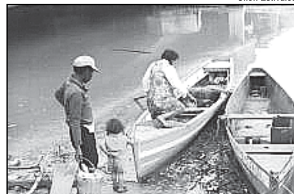
Família que vivia embaixo da ponte