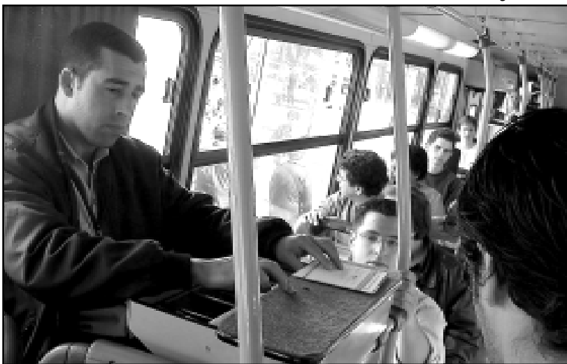
Objetivo é capacitar os funcionários da empresa para conduzir ônibus de transporte coletivo urbano

O aprendizado para a condução em transporte coletivo é tradição na Carris, que é a mais antiga empresa do ramo em atividade no país, fundada em 1872. Nos anos 40, a compa-