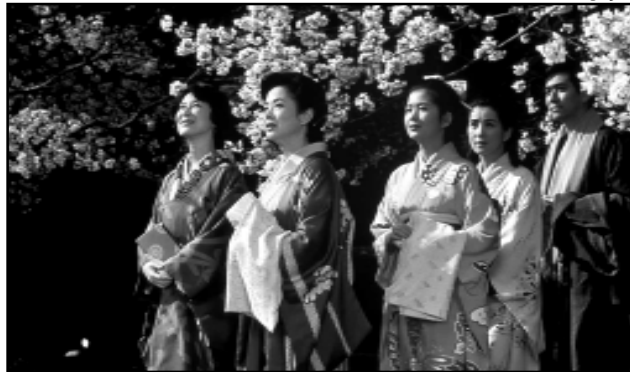
As Irmãs Makioka (1983), de Kon Ichikawa