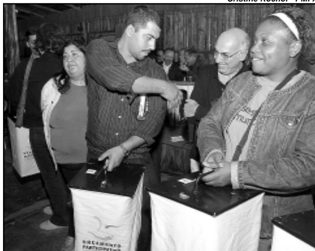
Preparatórias vão até o dia 12 de abril