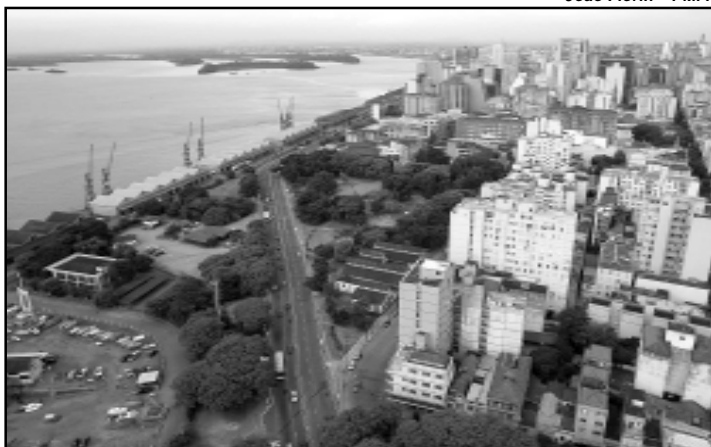
Porto Alegre será referência em governança e participação para municípios da África