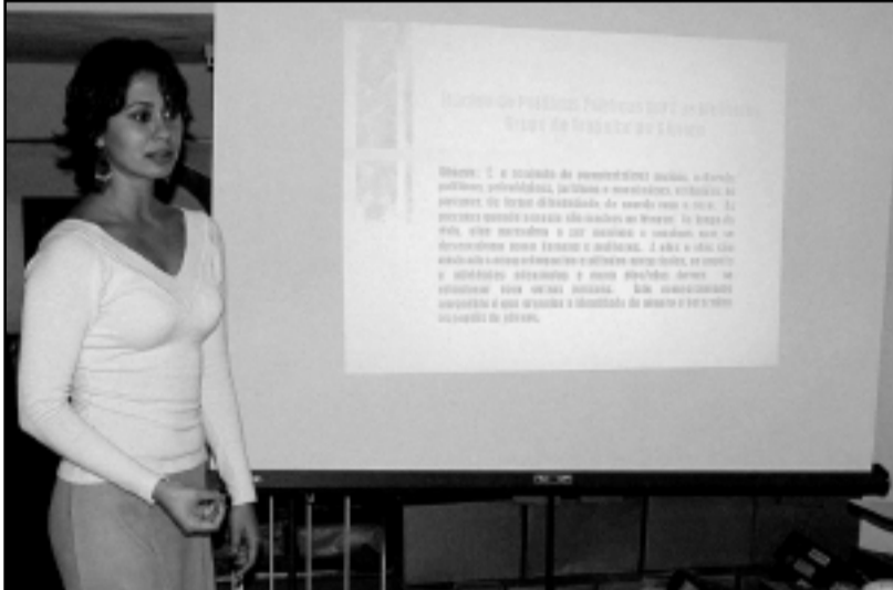
Alunos entre 11 e 17 anos terão oficina sobre drogas e violência