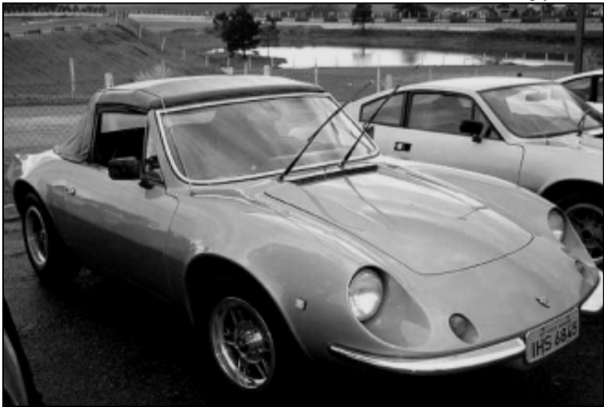
“Clube Amigos do Puma e do Miura” vai expor cerca de 20 carros