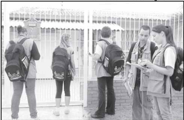
Entre 15 mil e 20 mil imóveis são visitados semanalmente