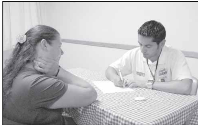
Em um ano, programa regularizou 720 atividades comerciais