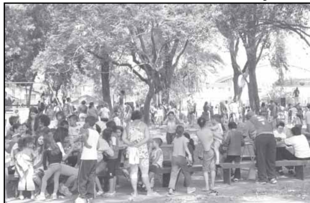
Programa da SME levou brincadeiras para as crianças