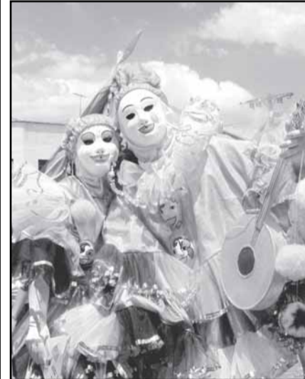
Beleza e alegria no agreste

A mostra pode ser visitada das 9 às 18 horas, de segundas a quintas-feiras, e das 9 às 15 horas, às sextas-feiras. Informações na Assessoria de Relações Institucionais da Câmara: (51) 3220-4392, e-mail claudiah@camarapoa.rs.gov.br.