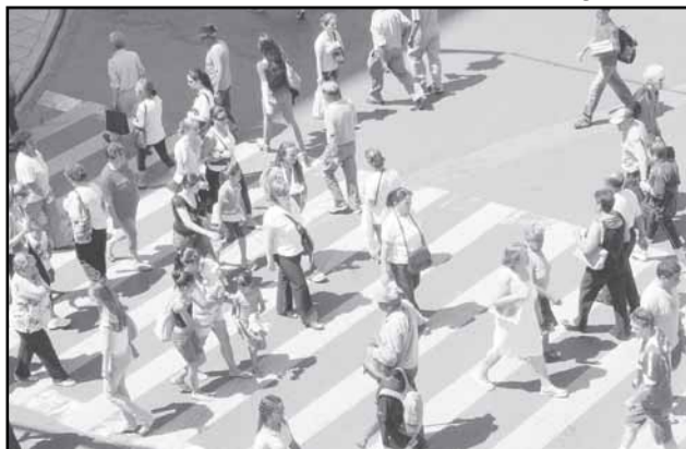
A prefeitura irá desenvolver um programa específico de proteção ao pedestre no trânsito