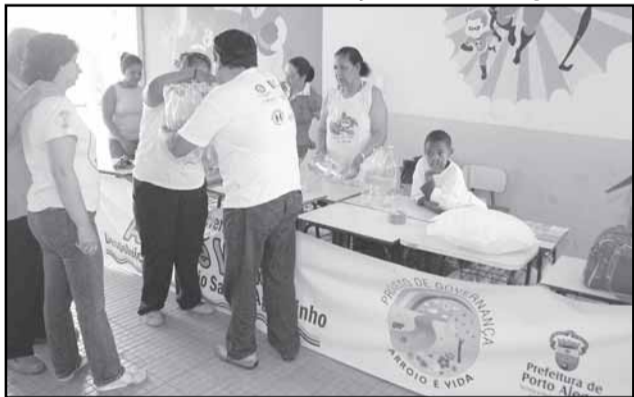
O Arroio é Vida foi iniciado na Escola Décio Martins Costa, com a implantação das patrulhas ambientais