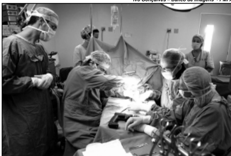
3.291 cirurgias já foram realizadas até hoje

O mutirão faz parte de um projeto para atender a demanda reprimida de cirurgias eletivas de média complexidade de pacientes do SUS que aguardam na fila até dezembro de 2004. Muitos desses pacientes aguardam há mais de 5 anos. Por