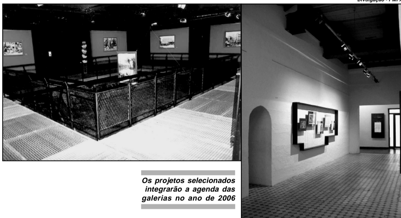
Os projetos selecionados integrarão a agenda das galerias no ano de 2006