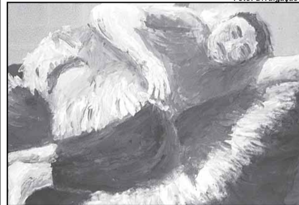
Obras exibem pinceladas vibrantes