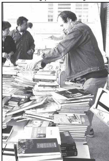
A segunda edição, promovida pela biblioteca e coordenação cultural da escola, será realizada amanhã

O grupo de contadores de histórias da escola também irá mostrar o repertório durante a feira, que contará com a apresentação de alunos que integram o projeto Cidade Escola, que vão expor seus trabalhos nas oficinas de criação textual e letramento. As atrações se diversificam ao longo do dia com a exposição de robótica, oficina de informática para alunos da Educação de Jovens e Adultos (EJA) e o lançamento do blog oficial da escola http://escolamarcirio21.blogspot.com/ .