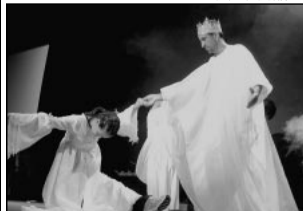
Peça estréia hoje na Capital