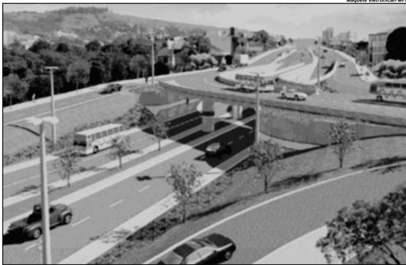
Ligação com a Aparício Borges é antecipada em pelo menos dez anos