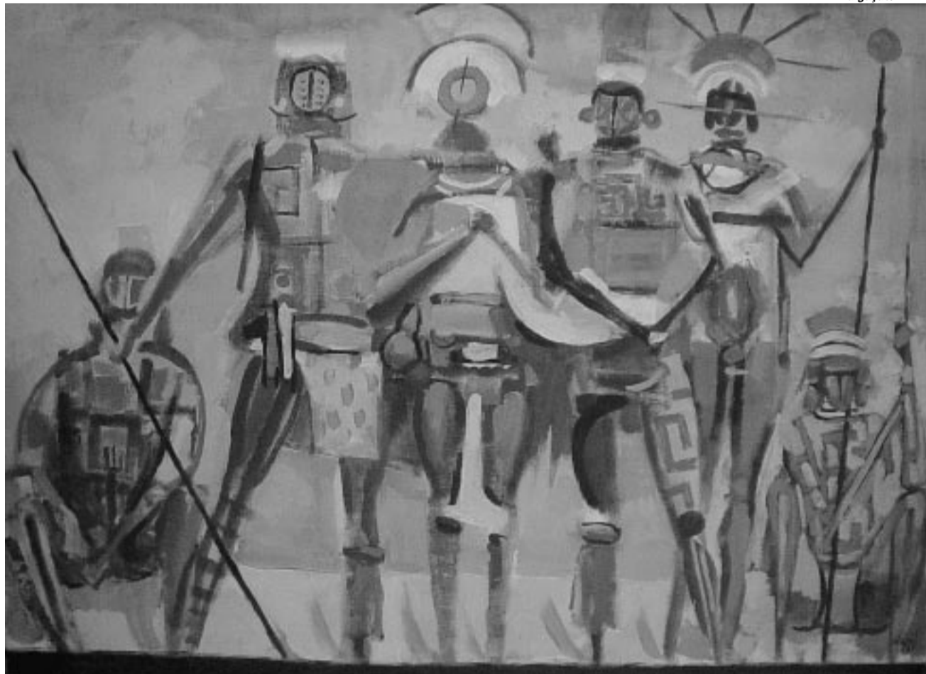
Os Caciques, de Carybé, é uma das obras que podem ser apreciadas pelo público