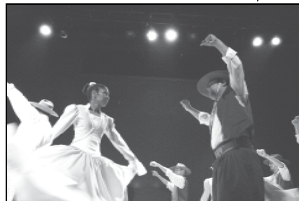
Teatro está disponível para manifestações culturais

Textos elaborados e de responsabilidade da Assessoria de Comunicação da Câmara