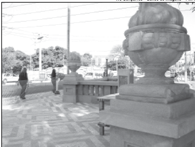
Os trabalhos estão concentrados na finalização da colocação de ladrilhos nos passeios públicos

A prefeitura investiu R$ 531 mil para recuperação do local e executou os serviços de reconstituição do guarda-corpo; aplicação de novo revestimento com as mesmas características do antigo; aplicação de pintura anti-pichação; colocação de novo ladrilho no passeio com desenho original à época da construção da ponte; reconstituição e tratamento da escadaria e instalação de luminárias que lembram as da época. A pista também sofreu intervenção com a aplicação de nova camada de asfalto.