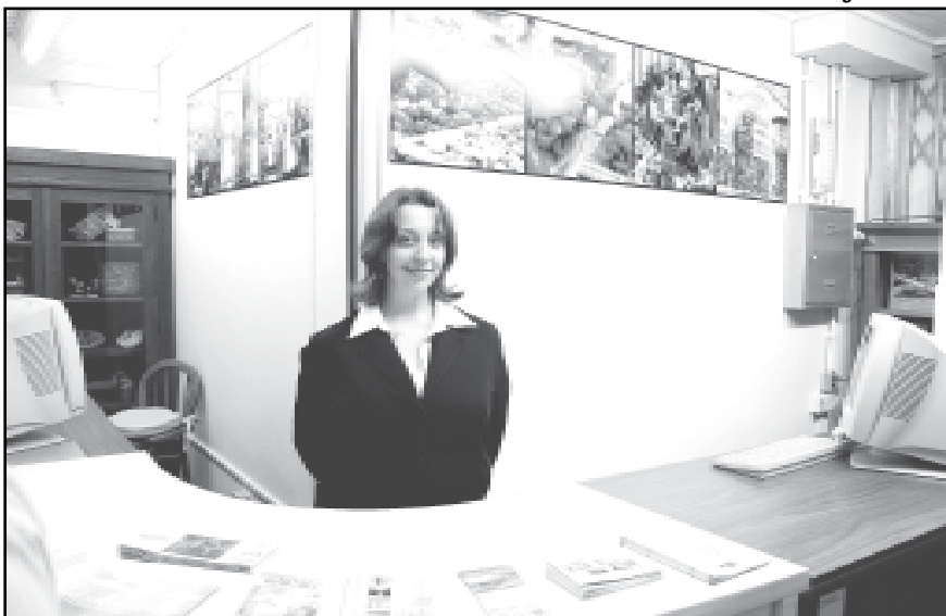
Serviço de Atenção ao Turista dará dicas e informações aos participantes

Com o tema “Agora, o Mercado é o Mundo”, o Fórum é considerado um dos maiores eventos de debate de idéias das Américas, e tem como objetivo debater a interdependência