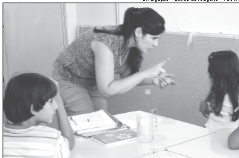
A Escola de Surdos foi uma conquista da Temática de Educação, Esporte e Lazer

Dois conselheiros titulares e dois suplentes eleitos em cada uma das seis plenárias temáticas;